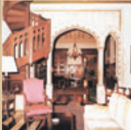
DE PRIORIJ VAN HERTOGINNEDAL (1262-1796)

Nachdem der Bericht in Venedig von der Außenministerkonferenz angenommen wurde, wird in Val Duchesse acht Monate lang intensiv über die Annahme der Verträge verhandelt. Hierbei geht es im Wesentlichen um die technischen Aspekte der steuerlichen, wirtschaftlichen und sozialen Harmonisierung sowie um die Schaffung neuer gemeinsamer Institutionen. Am Ende der Verhandlungen steht die Unterzeichnung der Römischen Verträge.