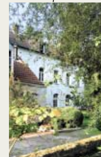
Maison du portier

→ Empruntez la route pavée qui traverse le site et passe entre les maisons du prieur et du meunier (P.XXX). Elle décrit ensuite une courbe devant l'étang du Moulin et vous ramène au point de départ.